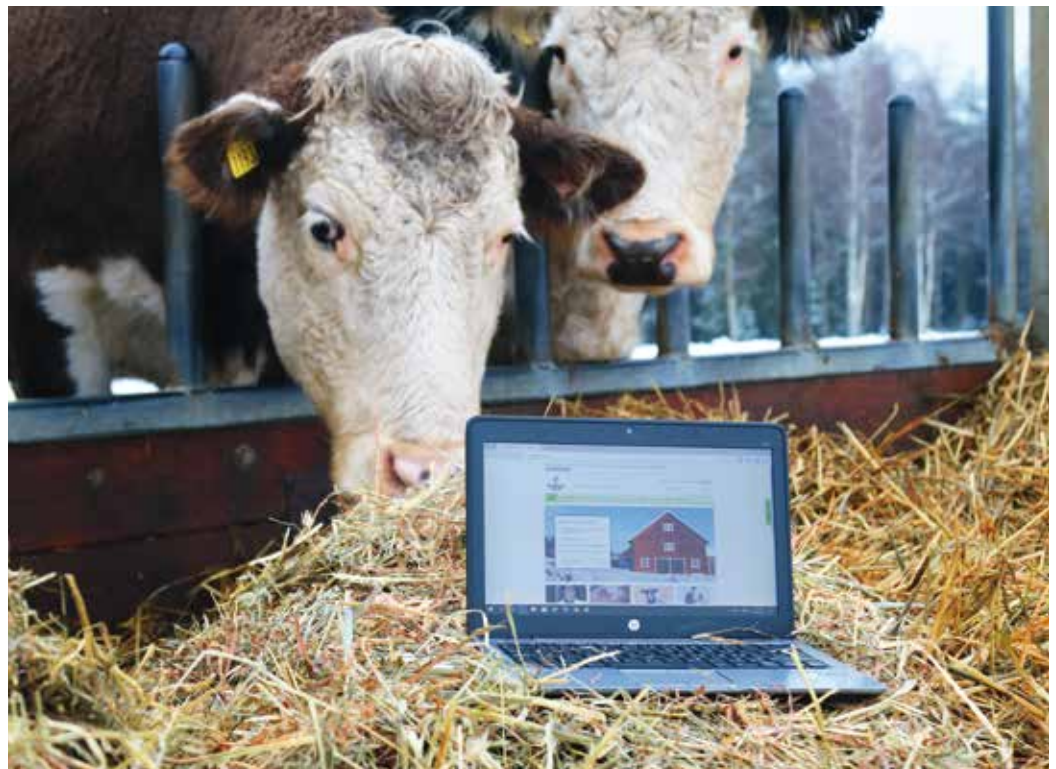
Ett produktionsverktyg som samlar alla viktiga uppgifter, är nyckeln till lönsamhet i företaget.

Det är stor skillnad på en kyckling och ett nötkreatur och de olika branscherna. Men oavsett vad som produceras behöver dess branschorganisation enkelt kunna ta fram relevant statistik för att följa den nationella produktionens utveck-